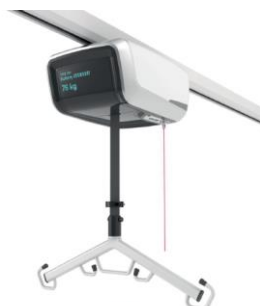
Deckenlifter UNILIFT Pro