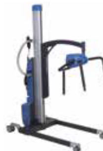
Patientenlifter LEXA PRO