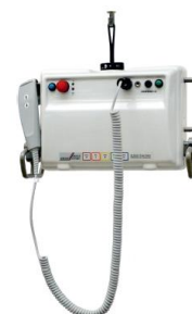
Portabler Deckenlifter UPL